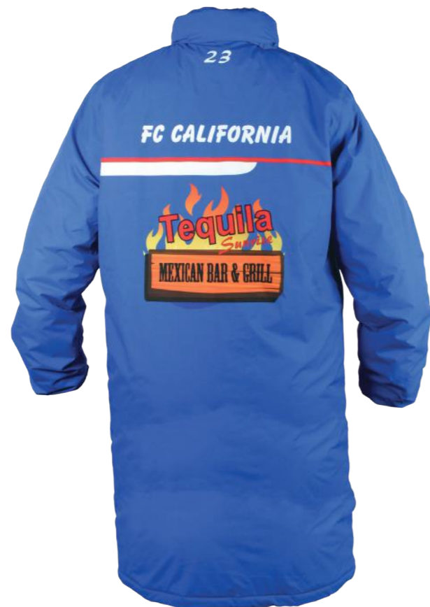
dorsal Elegir tipo, tamaño y color de letra