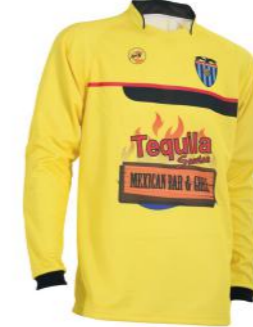
Camiseta de portero