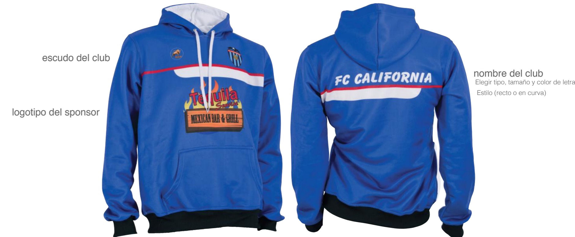
escudo del club