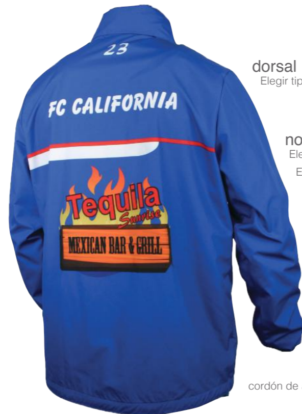
dorsal Elegir tipo, tamaño y color de letra