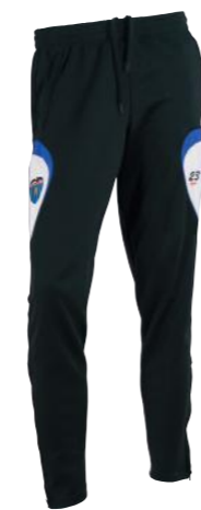
Pantalón de entrenamiento