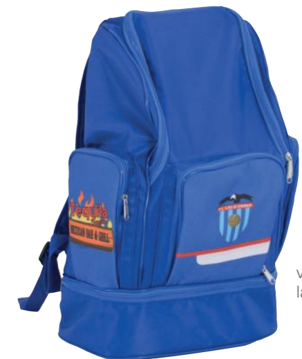
vista desde el lado izquierdo