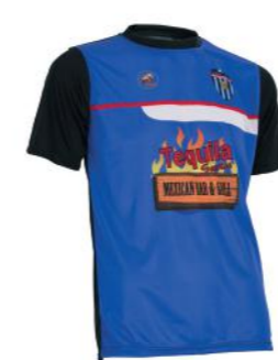
Camiseta de entrenamiento