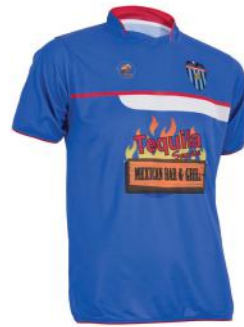
Camiseta / Pantalón corto