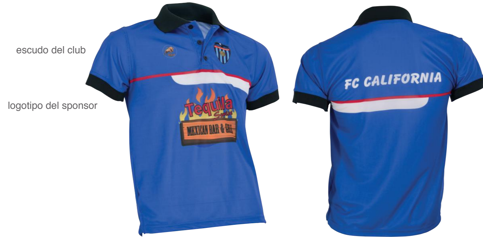
escudo del club logotipo del sponsor