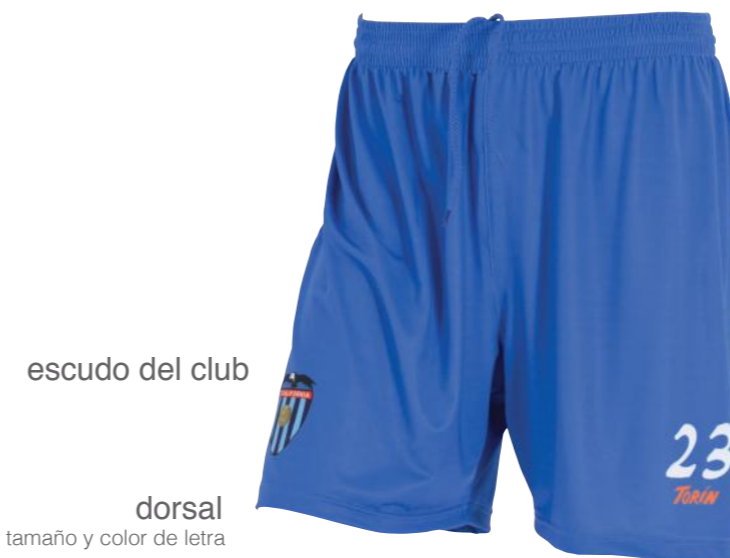
escudo del club