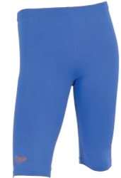
Calentador (tights térmica)