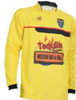
Camiseta de portero / Pantalón corto