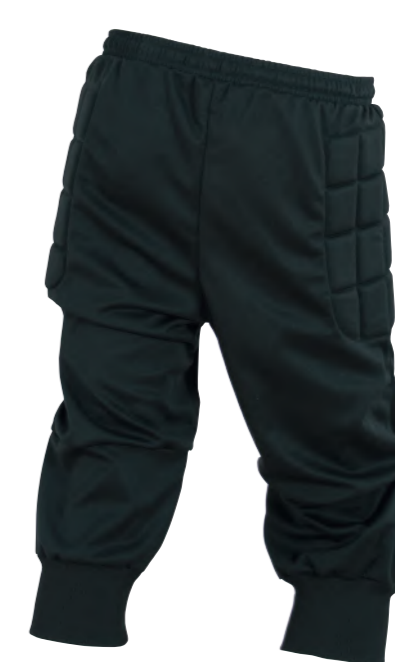
protección para cadera

Pantalón ¾ de portero con acolchado para cadera y rodillas.