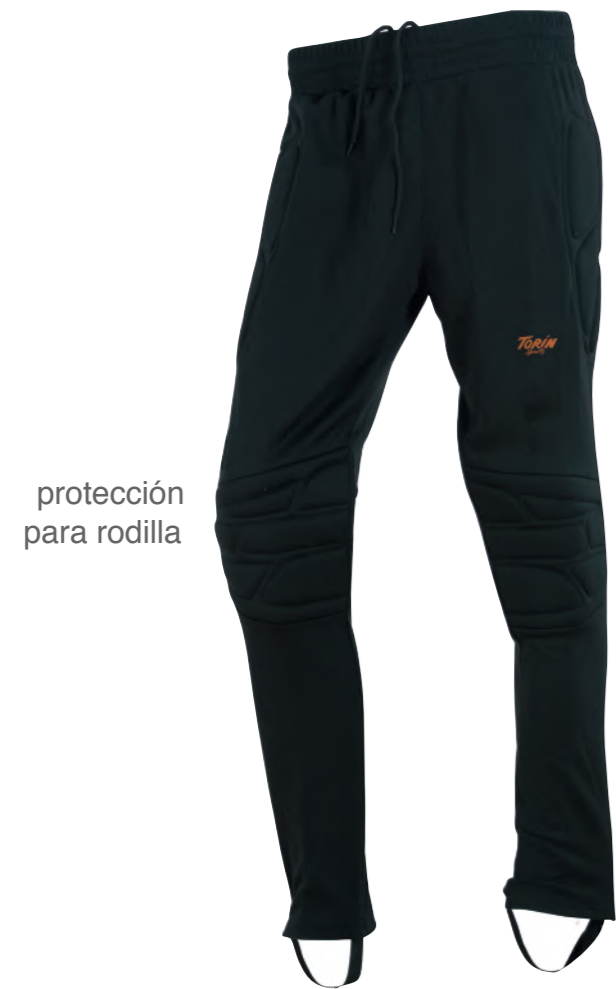
protección para rodilla