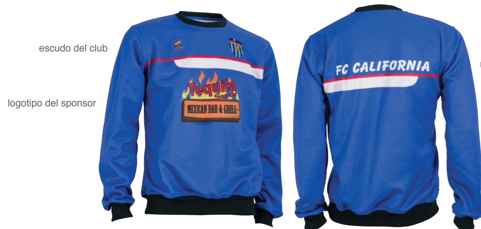
escudo del club