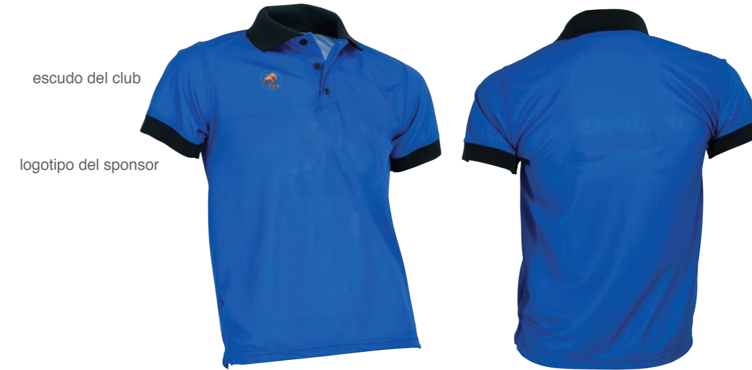
escudo del club logotipo del sponsor