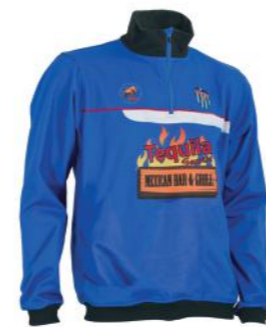
Training Top/ Sudadera/ Sudadera con capucha