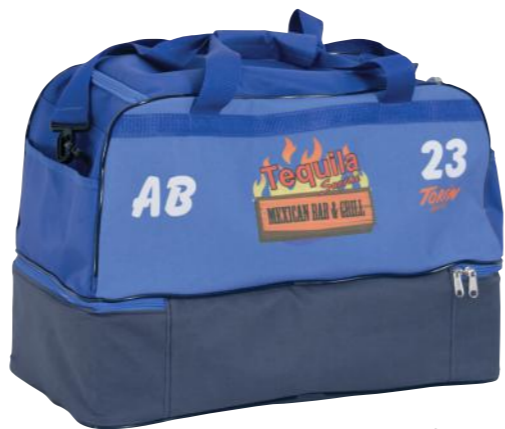
vista por detrás

escudo del club / logotipo del sponsor / nombre / iniciales / dorsal Elegir tipo, tamaño y color de letra