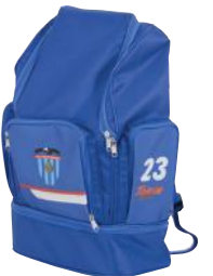
Mochila con zapatero