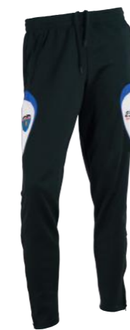
Pantalón de entrenamiento