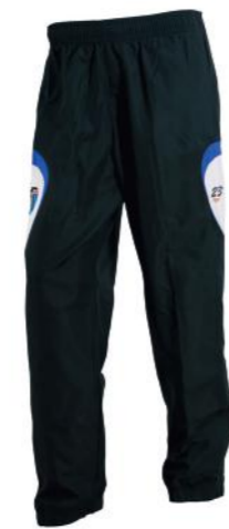
Pantalón de microfibras (Pantalón de paseo)