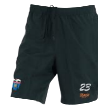
Pantalón corto de microfibras