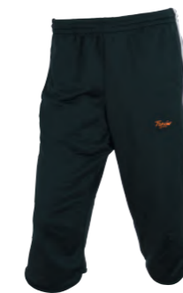
Pantalón 3/4 de entrenamiento