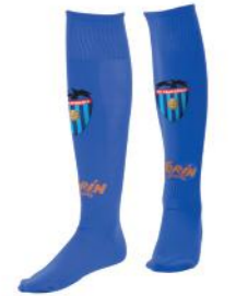
Medias de fútbol