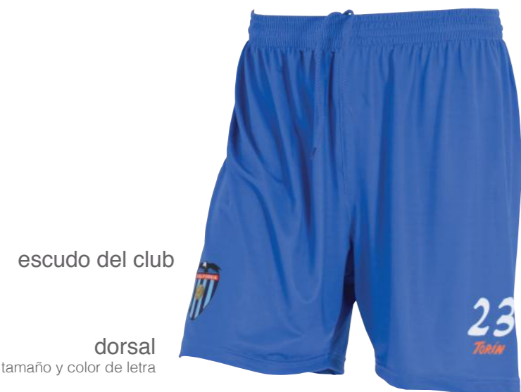
escudo del club