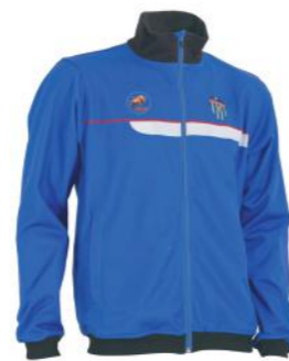
Chaqueta de entrenamiento