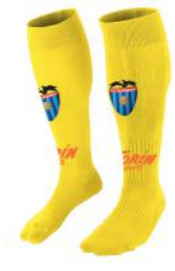
Medias de fútbol