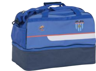
Bolsa con zapatero