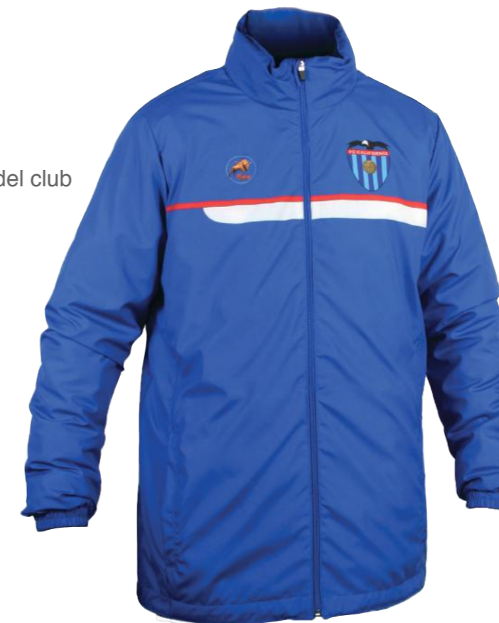
escudo del club