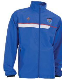
Chaqueta de microfibras (Chaqueta de paseo)