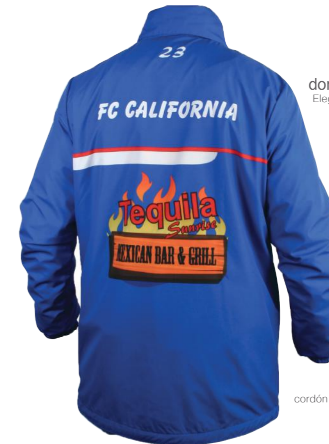
dorsal Elegir tipo, tamaño y color de letra