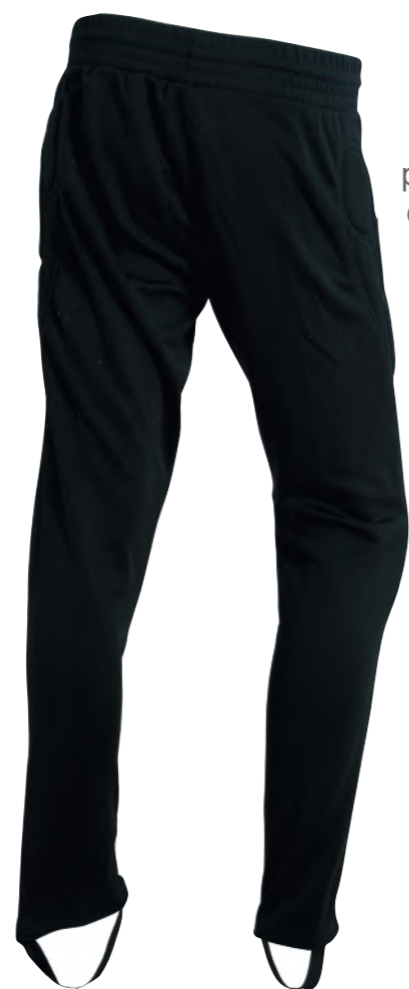
protección para cadera

Pantalón de portero con protección para cadera y rodillas.