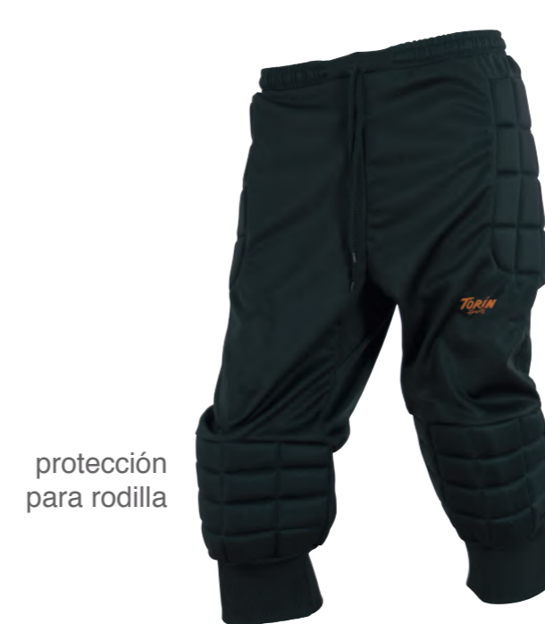
protección para rodilla