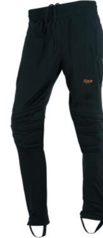
Pantalón de portero