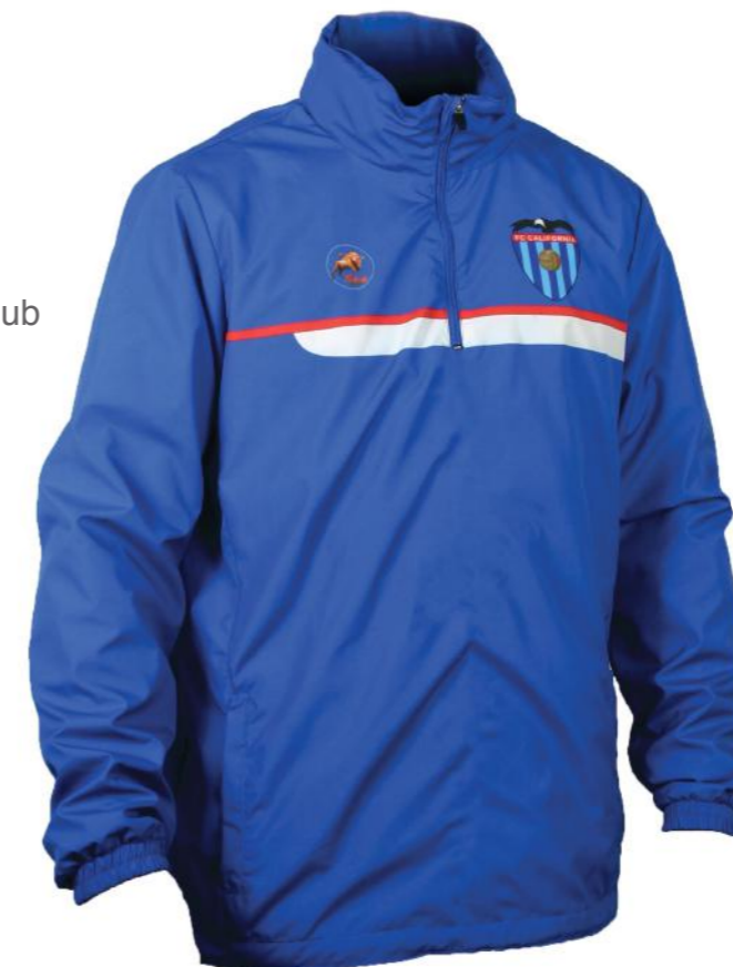
escudo del club