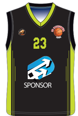
Camiseta / Pantalón corto