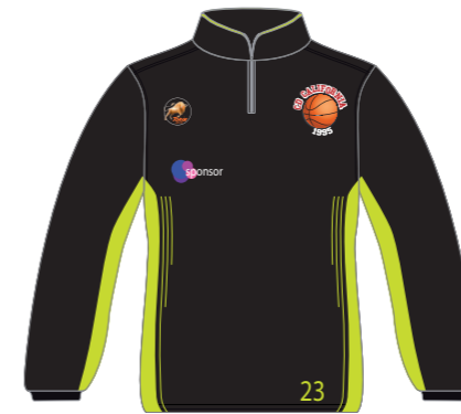
Training Top/ Sudadera/ Sudadera con capucha