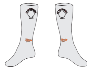
Calcetines (high cut)