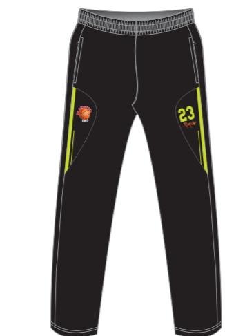
Pantalón de microfibra (Pantalón de paseo)