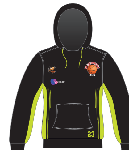
Sudadera con capucha