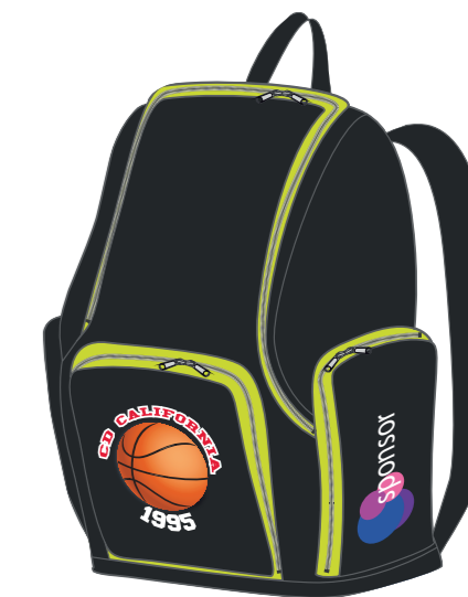
vista desde el lado izquierdo