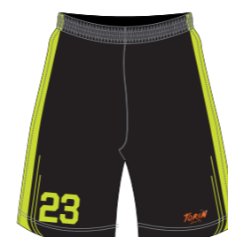
Pantalón corto de microfibra