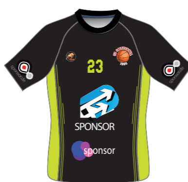
Camiseta de entrenamiento