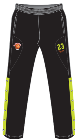
Pantalón de entrenamiento