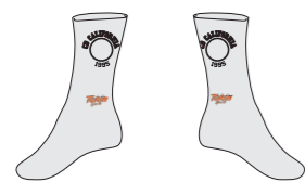
Calcetines (low cut)