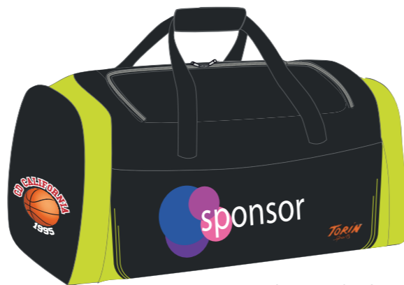
vista por detrás

escudo del club / logotipo del sponsor / nombre / iniciales / dorsal Elegir tipo, tamaño y color de letra