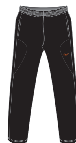
Pantalón de algodón