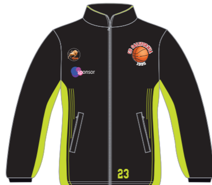
Chaqueta de entrenamiento