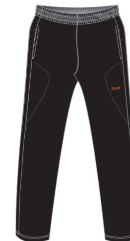
Pantalón de algodón