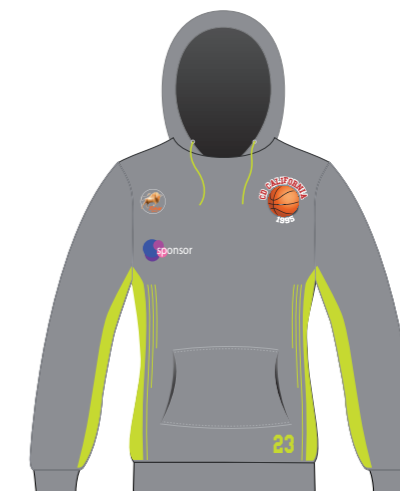
Sudadera con capucha