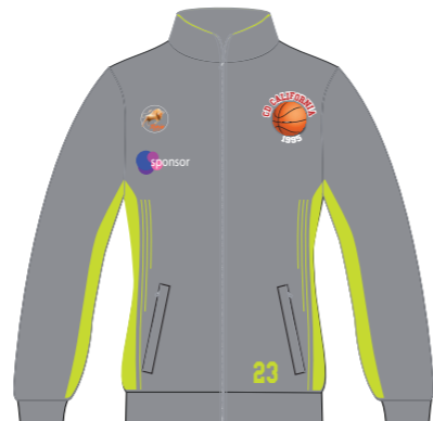
Chaqueta de entrenamiento