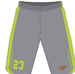
Pantalón corto de microfibra