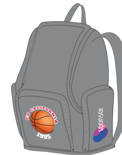
vista desde el lado izquierdo