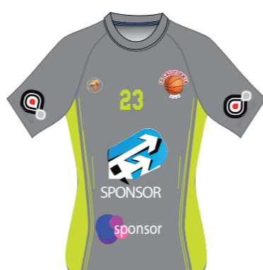
Camiseta de entrenamiento