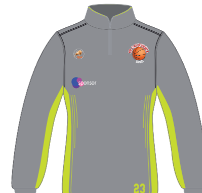
Training Top/ Sudadera/ Sudadera con capucha