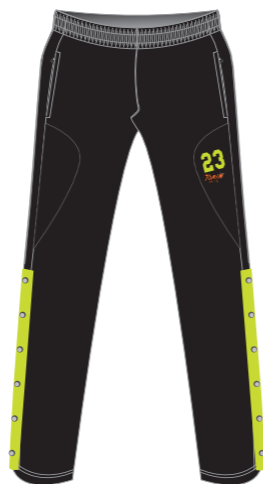
Pantalón de entrenamiento