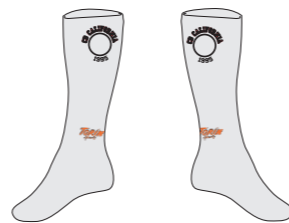
Calcetines (high cut)