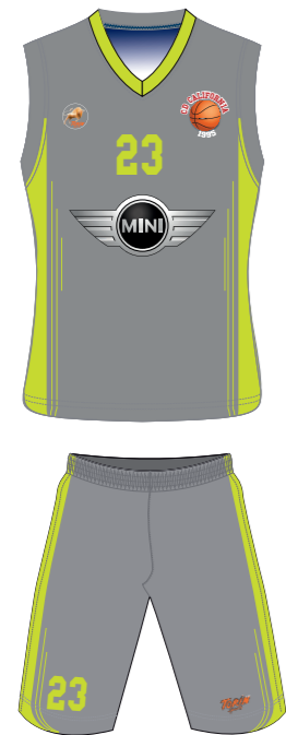
Camiseta / Pantalón corto