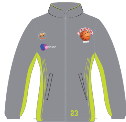
Chaqueta de microfibra (Chaqueta de paseo)