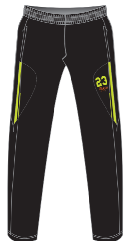
Pantalón de microfibra (Pantalón de paseo)