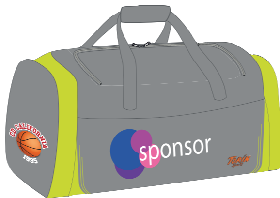
vista por detrás

escudo del club / logotipo del sponsor / nombre / iniciales / dorsal Elegir tipo, tamaño y color de letra